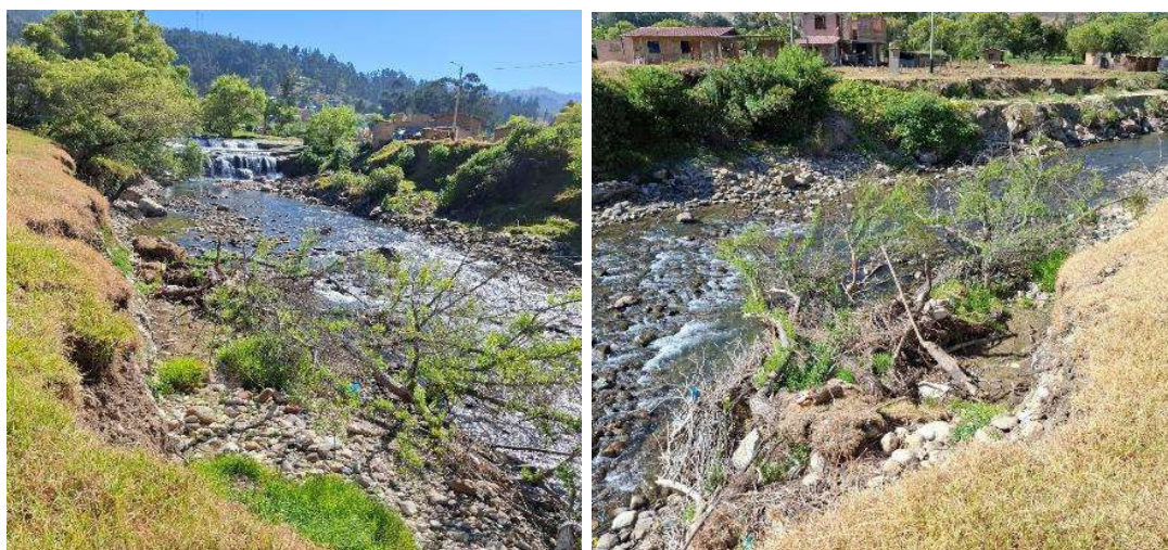
FIGURA N°02: TRAMO CRÍTICO EN EL RÍO CHONTA, SE APRECIA LAS RIBERAS DEL RIO QUE ESTAN SIENDO SOCAVADAS