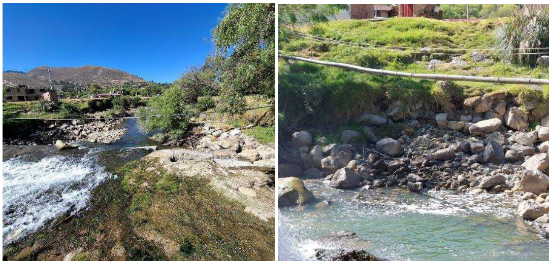
FIGURA N°03: TRAMO CRÍTICO EN EL RÍO CHONTA, SE APRECIA LAS RIBERAS DEL RIO QUE ESTAN SIENDO SOCAVADAS