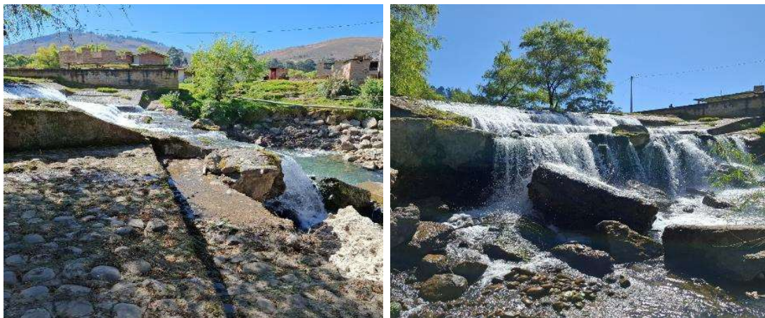
FIGURA N°01: TRAMO CRÍTICO EN EL RÍO CHONTA, SE APRECIA EL SOCAVAMIENTO DE BOCATOMA DEL CANAL DE RIEGO CRISTO REY